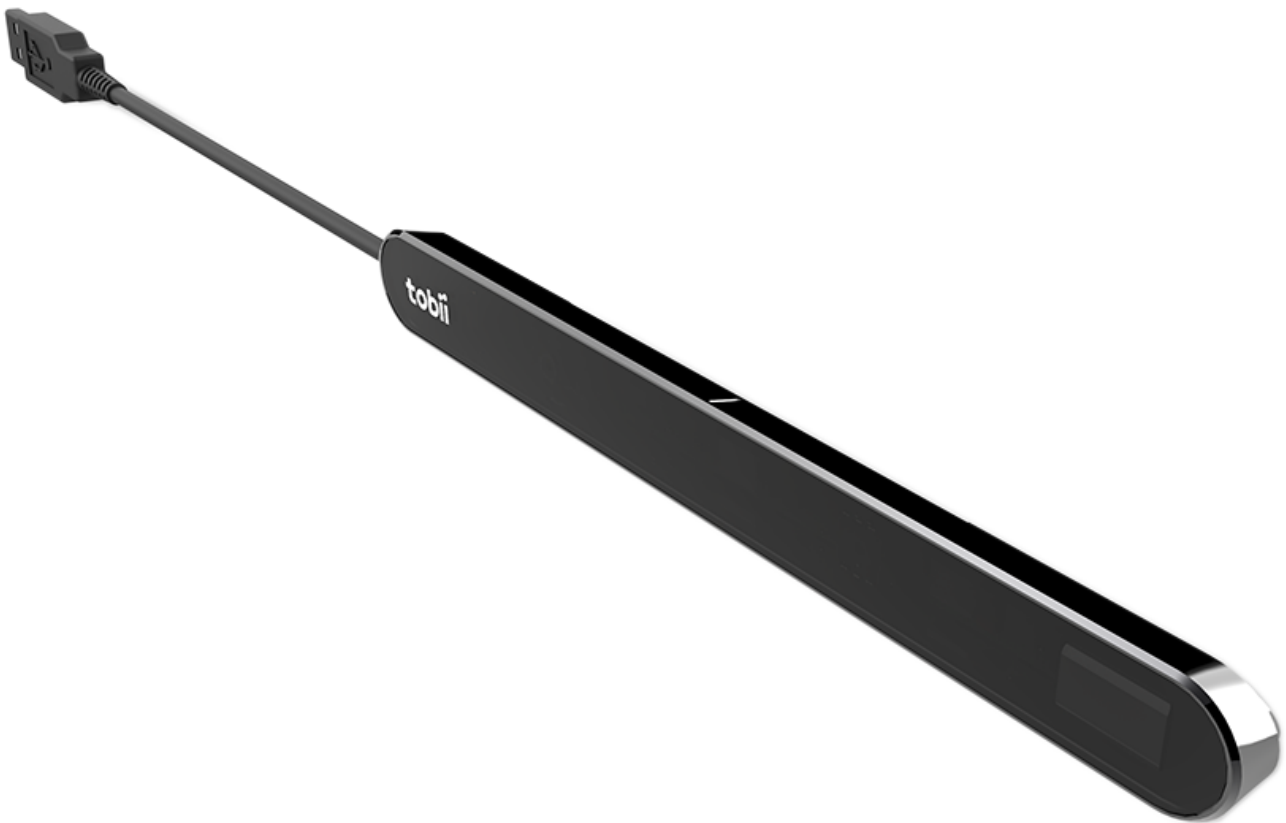
Εικόνα 1.1 PCEye Mini

Για περισσότερες πληροφορίες για τα μεγέθη της οθόνης, δείτε το Παράρτημα C Τεχνικές προδιαγραφές .