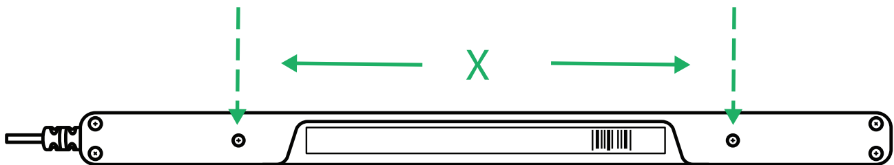
Figura 4.1 Distanza C-C tra le viti M3

Per fissare PCEye 5 in modo permanente, ci sono due (2) viti M3 sul retro di PCEye 5. La distanza C-C (contrassegnata con X) in Figura 4.1 Distanza C-C tra le viti M3, pagina 9 è 155 mm. PCEye 5 È compatibile con la staffa GA EyeGaze-Bracket di Rehadapt GmbH.